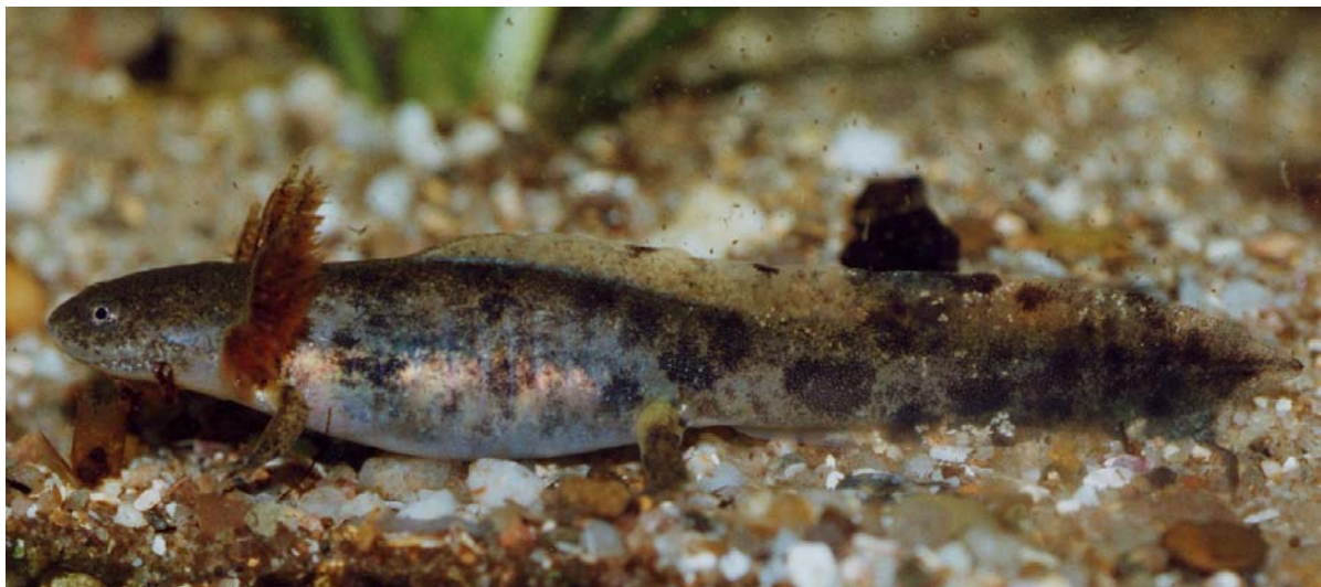
Hynobius dunni , larve.

Het uitkomen van de eieren leverde geen problemen op. In 1999 kwam ruim 80% van de eitjes uit. Slechts enkele eieren gingen ten onder aan schimmel ( Saprolegnia sp.). Daarna dook echter een probleem op. Een groot aantal larven kwam boven drijven met een 'gasbuik' syndroom. Dit probleem hield aan tot dat de larven een lengte hadden bereikt van 3 cm. Dit bleek in bijna alle gevallen dodelijk te zijn. Doorprikken noch frequente waterverversing leverde geen positief resultaat op. Mogelijk was dit te wijten aan de gehanteerde (hogere) temperaturen waardoor het metabolisme op een te hoog niveau uitkwam. Een andere mogelijkheid kon een infectie en of een vergiftiging vanuit het aangekochte voedsel zijn (rode muggenlarven). Frappant was wel dat de overlevende larven zonder verdere problemen werden opgekweekt met hetzelfde voedsel.