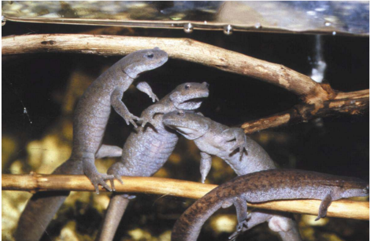
Groep mannetjes van Hynobius dunni.

H. dunni leeft vrij verscholen en is pas actief bij temperaturen onder 14 °C, waardoor activiteit voornamelijk in de lente en herfst plaats vindt. In deze perioden vindt men de salamanders tijdens de avondschemering in de waterpartij. Tijdens de zomer en winter verblijven ze op zeer vochtige plaatsen op het landgedeelte. De salamanders houden zich vaak op in de eerder aangehaalde isolatieholten. Bij voorkeur in die openingen die deels in het water steken. Mijn inziens doet zich buiten de voortplantingstijd een omgekeerde relatie voor tussen leeftijd en de aanwezigheid in het water: jongere dieren zijn buiten de voortplantingsperiode regelmatig in het water te zien en volwassen dieren verblijven in deze periode vooral op het land.