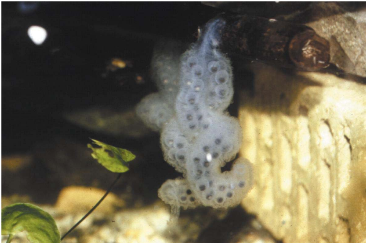
Eizak van Hynobius dunni.