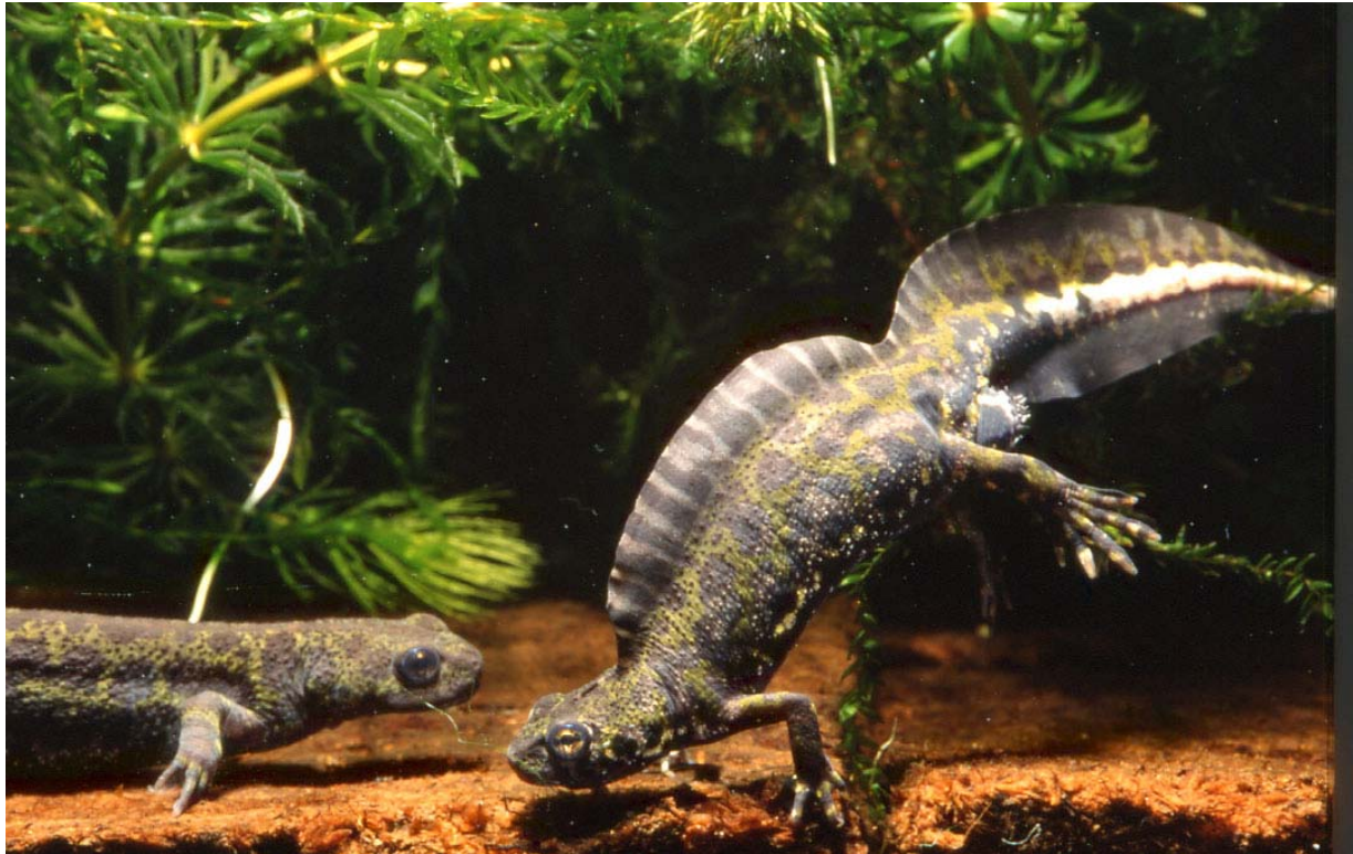
Baltsende Marmersalamanders, Triturus marmoratus.