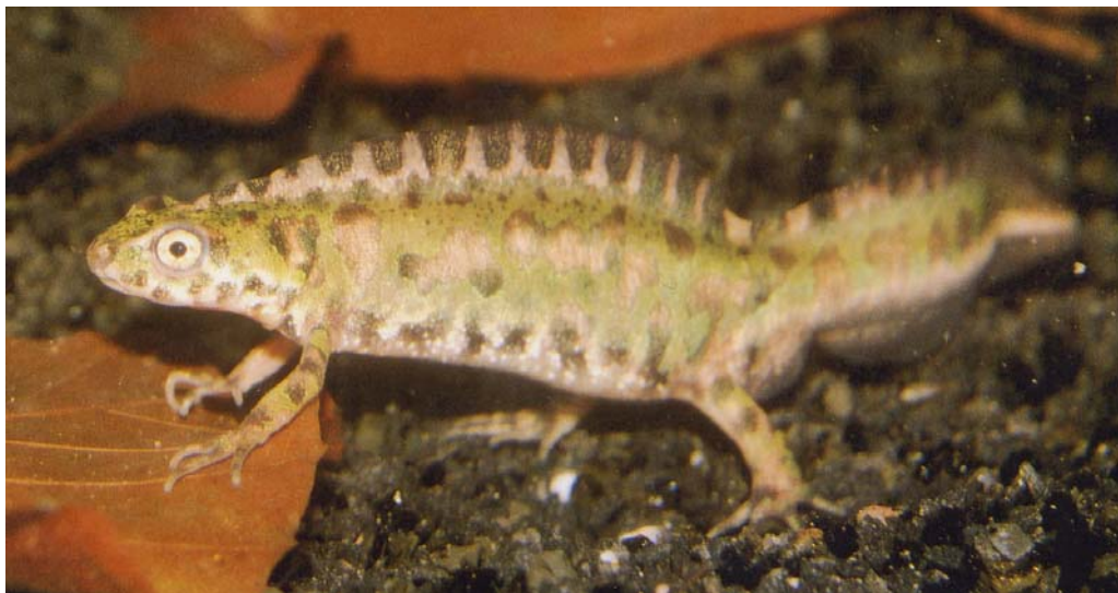
(Zuidelijke of) Dwerg-marmersalamander, Triturus pygmaeus (foto: Sergé Bogaerts).

De leefwijze van T. marmoratus is ongeveer gelijk aan die van T. pygmaeus . Alleen is er een groot verschil in het tijdstip dat de salamanders het water intrekken en zich voortplanten. T. pygmaeus verblijft in het water van het einde van de herfst tot in het voorjaar en plant zich in deze periode voort en houdt een zomerrust op het land. T. marmoratus verblijft van het vroege voorjaar tot in de zomer in het water. De voortplanting vindt in het voorjaar plaats en de salamanders overwinteren op het land. Dit is echter wel sterk afhankelijk van het gebied waar de dieren leven. Ter illustratie is in een tabel weergegeven in welke periode de volwassen dieren zich in het water bevinden voor de voortplanting. Natuurlijk zijn dit gemiddelden en kan dit per jaar variëren. Dit heeft te maken met de klimatologische omstandigheden ter plaatse. Interessant is dat ook verschil in hoogte belangrijk is. In Noord-Portugal zijn dieren die op 1500 m hoogte voorkomen pas in mei in het water, terwijl dieren die een 10-tal kilometers daar vandaan op 550 m hoogte voorkomen in de herfst het water ingaan (CAETANO & CASTANET, 1993). Volledig aquatische populaties zijn niet bekend. Slechts in de Serra de Sintra werden door MALMUS (1995), met uitzondering van de maand september, dieren het hele jaar in het water aangetroffen.