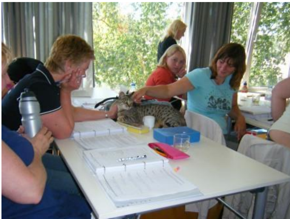
Een goed gesocialiseerde Savannah F3 poes kan mensgericht zijn. Dit is tevens afhankelijk van de mensgerichtheid van de voorouders. Deze Savannah wordt meegenomen in lessen over kattengedrag.

Mocht een toekomstige eigenaar toch een kat uit het buitenland halen, overweeg dan of om toch eerst gaat kijken bij de fokker. De huisvesting kan bekeken worden en de ouderdieren of familieleden. De reiskosten die daar aan besteed worden, zijn altijd nog lager dan de aanschafwaarde van de Savannah; het is per slot van rekening toch een dier wat vele jaren bij zijn eigenaar gaat wonen.